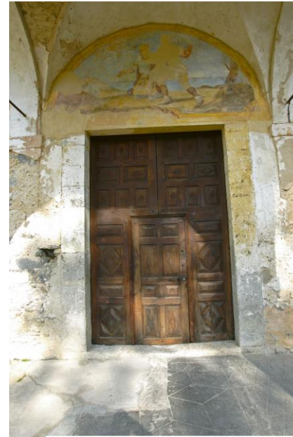
Eglise Ste Croix

La tradition était de se rendre à St Donat invoquer le saint en vue d'obtenir une faveur. Une famille de Marie sur Tinée qui avait un petit garçon aveugle d'environ 5 ans, décida d'aller à St Donat pour qu'il fasse quelque chose pour leur fils. Quand ils arrivèrent à Bonfillon, le rocher en face St Donat, il s'est mis à pleuvoir et le petit dit : « Oh ! Papa, mama, es avasso San Dounat ? Oh ! coumo's bello, coumo's bello, bello, bello ! vé un bel santo ! coumo's bello ! » Les parents heureux de constater la bonté de St Donat, s'en retournèrent, mais avant d'arriver à Marie, le petit était à nouveau aveugle.