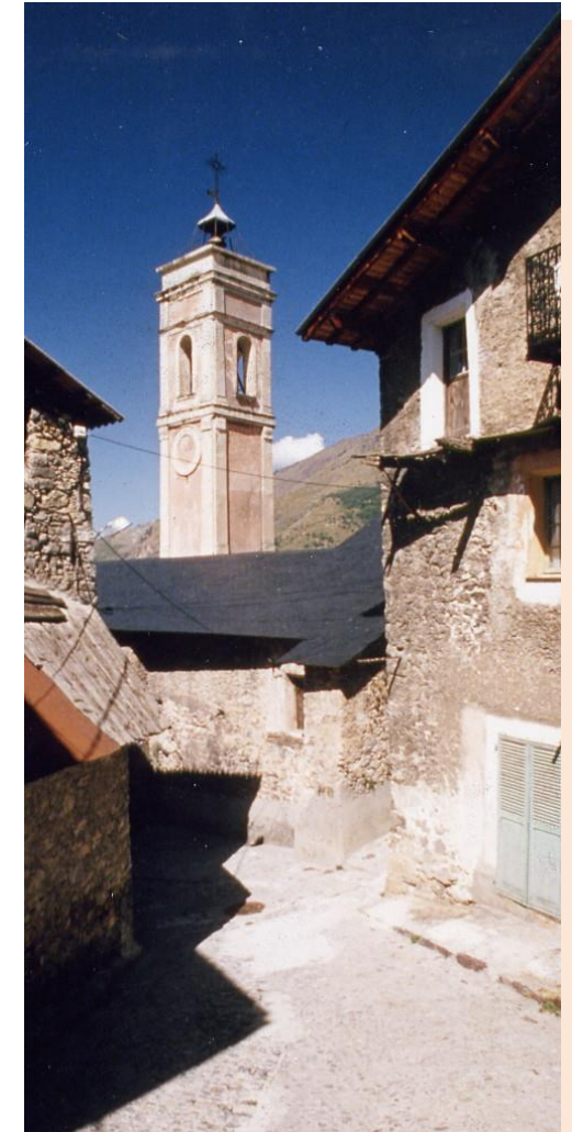
La Roche Chapelle de l'Annonciation.

Saint Jean Baptiste est fêté le 24 juin. Il vécut au 1 er siècle de notre ère. C'est le précurseur du Christ. On dit de lui que parmi ceux qui sont nés de la femme, il n'y eut jamais de plus grands que Jean-Baptiste. Il prêcha la venue du Christ sur terre et l'on entendait sa voix jusqu'au fin fond du désert. Lorsque le Christ arriva, il le baptisa à sa demande, dans les eaux du Jourdain, puis il le suivit. Il mourut décapité dans la ville de Machéronte en Pérée.