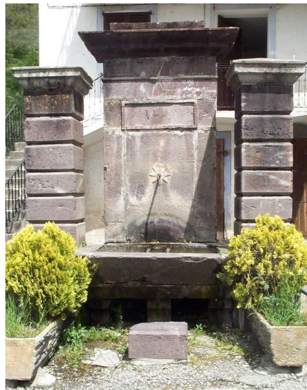
Fontaine de La Bolline

A droite enfin, le chemin du Portalet qui contourne le village et le vieux lavoir où sur le rythme des battoirs on apprenait les « leris ». La route à gauche amène à la « Fuount Luegno », première fontaine du village, et de là vous découvrez l'église Ste Croix.