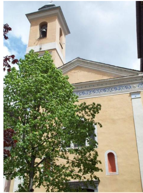
Chapelle des Pénitents Blancs