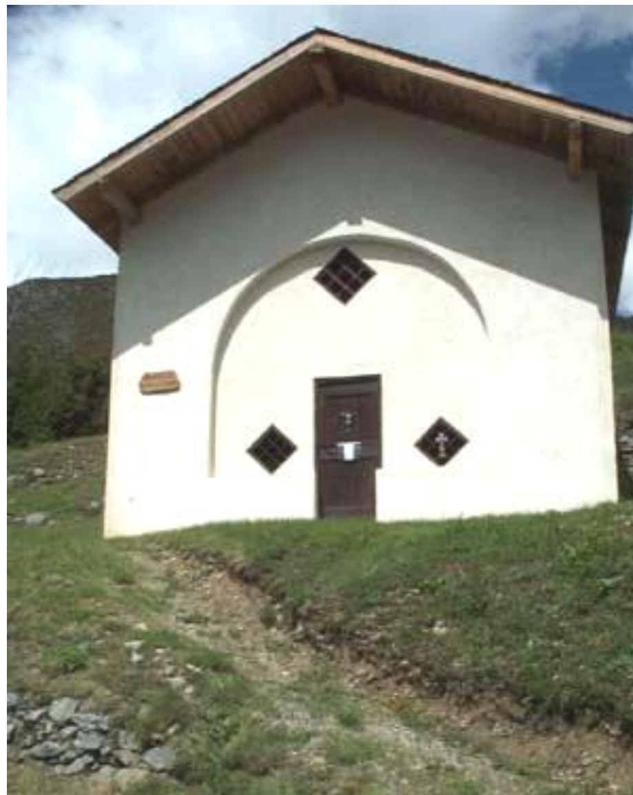
Chapelle St Joseph

A noter également les deux bénitiers de l'entrée et la statue de St Donat.