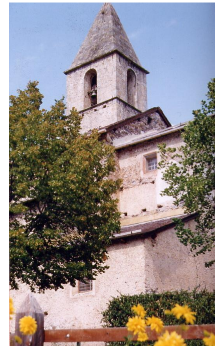
Eglise Saint Jacques le Majeur